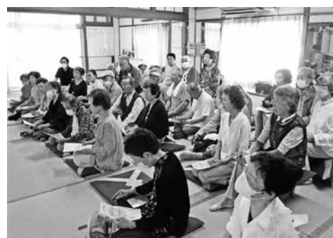
資料を手に熱心に聞き入る参加者

このたび6月19日の懇親会には草加市保健センター春日講師をお迎えして『人生百年時代を元気で過ごす為の日常生活について』と題した講演をお願いしました。当日は