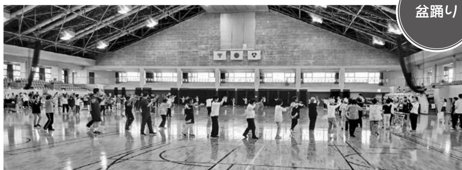
みんなで踊って楽しみました