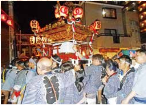
勇壮な 500 貫神輿

今年も八幡神社の例大祭（お祭り）が7月19日（土）～20日（日）の2日間に渡り行われました。草加の祭りは旧道（旧日光街道）の1丁目～6丁目の間で1丁目～3丁目、4丁目～6丁目の2分割されて行われており、7月中旬の祭りは八幡神社の1丁目、2丁目、3丁目の3町間内で行われました。年番制が決められ、今年は1丁目が年番でした。八幡神社のお神輿は「500貫みこし」