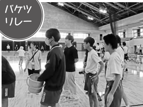
中学生も笑顔で参加