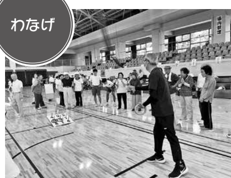
得点に会場も一喜一憂