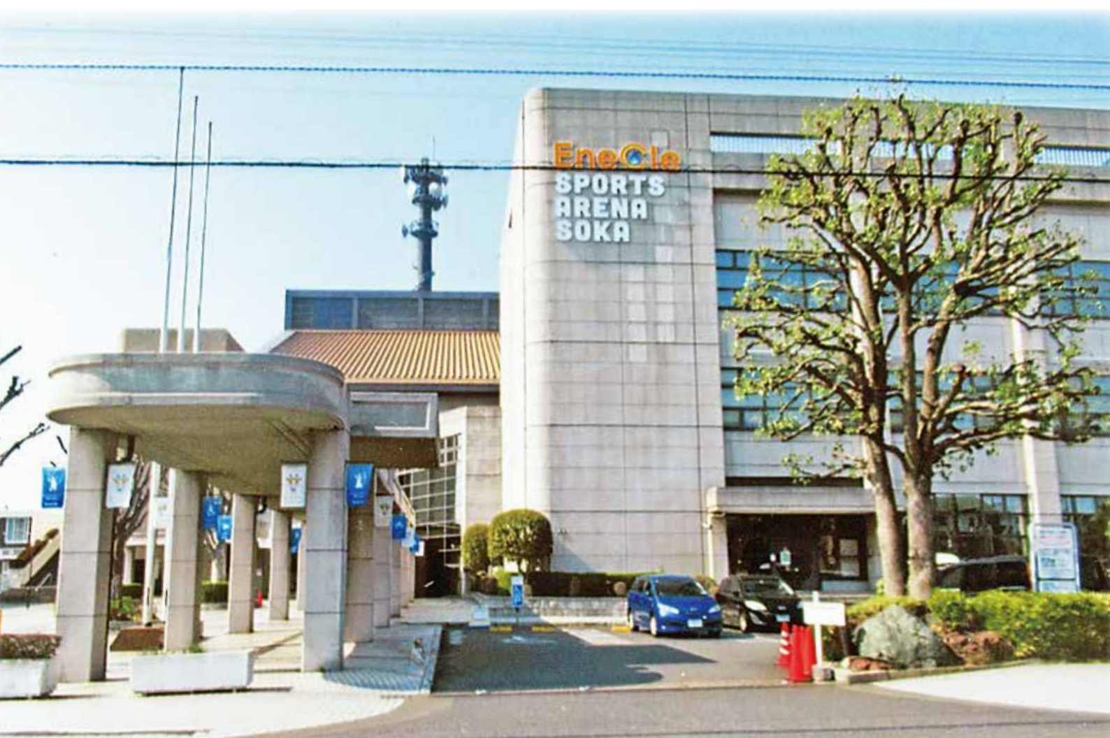
エネクルスポーツアリーナSOKA