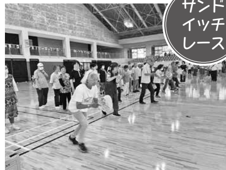
急いでも落とさないように