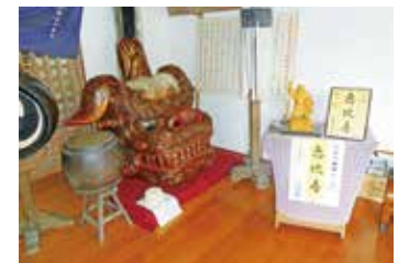
草加市指定文化財八幡獅子頭

その上、揉み方も《草加もみ》として独特の揉み方で、慣れないと重いこともあり担ぎ方も難しい揉み形で行われており、猛暑の中を年番町はお神輿を見事な揉み方で2日間担ぎ上げ、観衆の拍手喝采を浴びておりました。