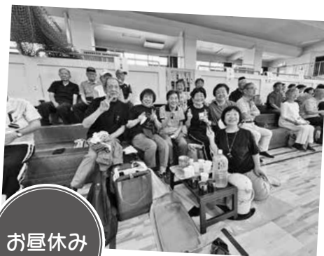
楽しいお昼のひととき