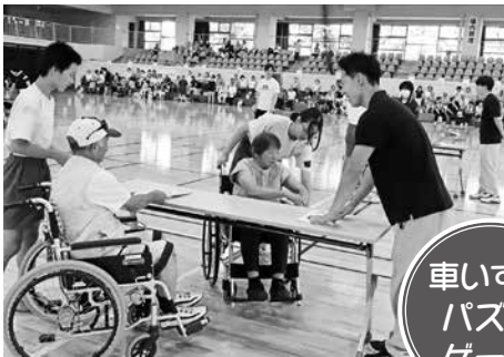
協力して頑張ります