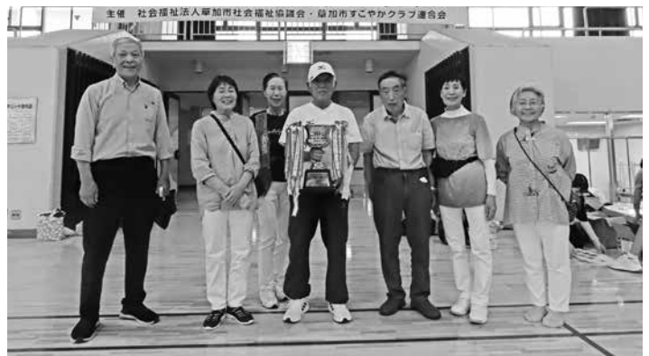
わなげ団体優勝した苗塚健やかクラブの皆さん