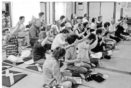
講師の質問に手を上げて答える会員

西町第一さつき会は昭和46年に設立以来54年になります。設立以来会員の月例会と称して、毎月町会の会館に集まってカラオケを歌ったり踊ったり、楽しいひとときに親睦を図ってまいりました。