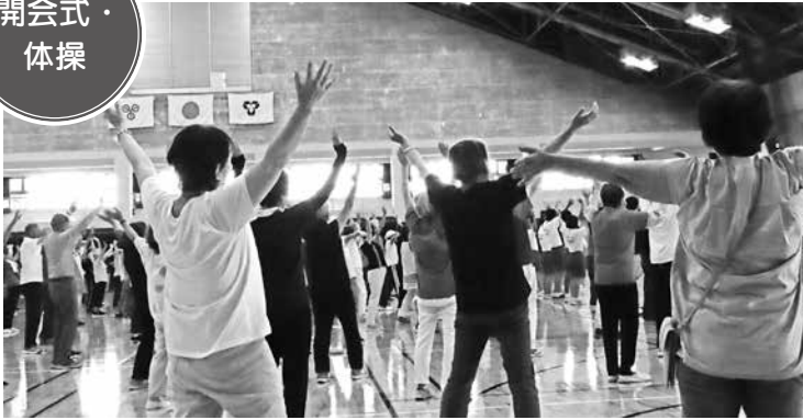
準備運動はしっかりと