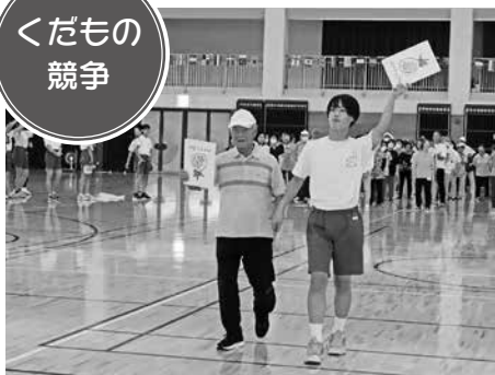
世代は違えどナイスコンビ