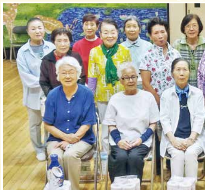
第5ブロックの入賞者の皆