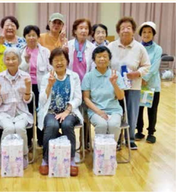
ブロックの入賞者の皆さん