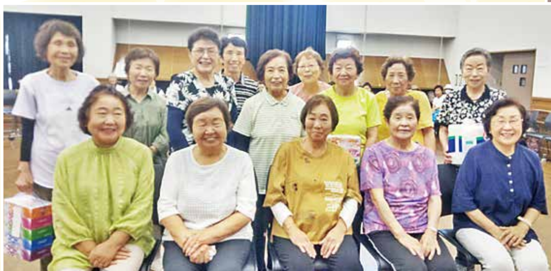
第4ブロックの入賞者の皆さん